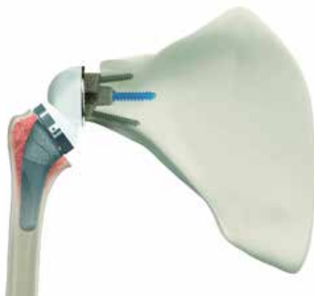
AEQUALIS ASCEND™ FLEX Convertible Shoulder System der Firma Wright/Tornier

dende Implantat auswählen, die optimale Platzierung festlegen und den zu erwartenden Bewegungsumfang im Vorfeld einschätzen (Abb. 3).