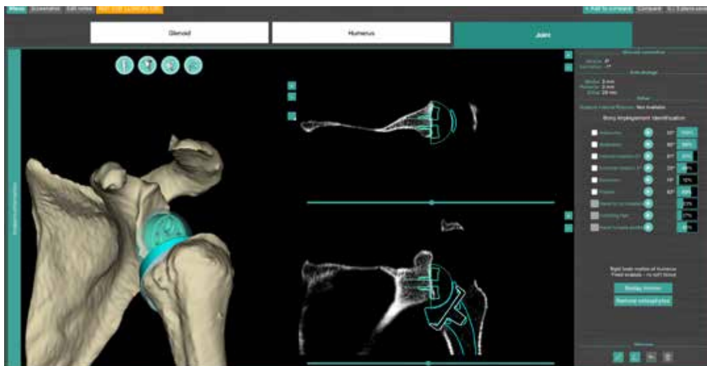
Abb. 3: Moderne 3D-Planungssysteme wie Blueprint (Tornier) ermöglichen die Wahl des geeigneten Implantats und liefern an Hand der knöchernen Geometrie der Schulter sowie der optimalen Platzierung der Endoprothesenkomponenten den zu erwartenden Bewegungsumfang.

In den letzten Jahren wurden zudem die Implantatdesigns und -konfigurationen modifiziert, um die Funktion zu verbessern, Komplikationen zu reduzieren und knochensparender vorzugehen. Eine Lateralisierung auf Glenoid- und Humerusseite wurde beschrieben, um die Rotationsbewegungen zu verbessern, und das Anschlagen der Endoprothese am Schulterblatthals („Notching“) zu verringern (Abb. 4 a und b). Dieses Konzept der bipolaren Lateralisation führt zu hervorragenden klinischen Ergebnissen, niedrigen Komplikationsraten und geringen Raten von radiographischem „Notching“. Zusätzlich ermöglichen augmentierte Implantate („full-wedge“ Basisplatten) eine einfache Korrektur