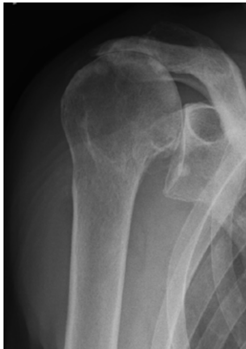
Abb. 4 a und b: Fortgeschrittene Defektarthropathie eines rechten Schultergelenks (a) mit dem einer bipolaren metallischen Lateralisierung durch eine knochensparende inverse Kurzschaftendoprothese versorgt (b).