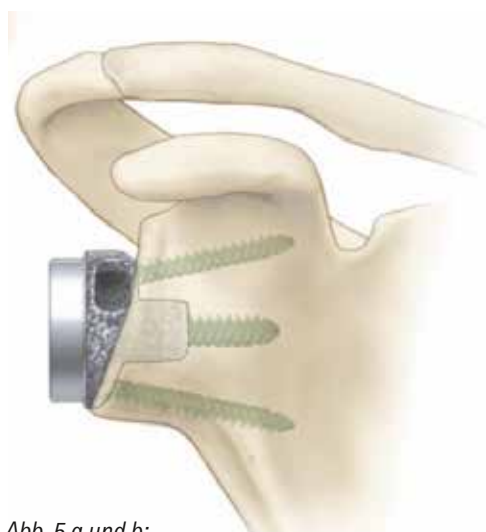
Abb. 5 a und b: Schemazeichnung (a) und postoperatives Röntgenbild (b) einer metallischen Rekonstruktion eines kranialen Pfannendefekts mit einer „full-wedge“ Basisplatte Aequalis PerFORM Reversed und des Aequalis Ascend Flex Schaftes der Firma Wright/Tornier.