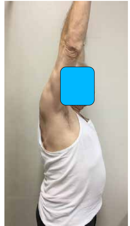
Abb. 2 a und b: 72-jähriger Patient vor (a) und nach Implantation (b) einer inversen Endoprothese der rechten Schulter. Ein komplettes und schmerzfreies Anheben des Armes ist wieder möglich.