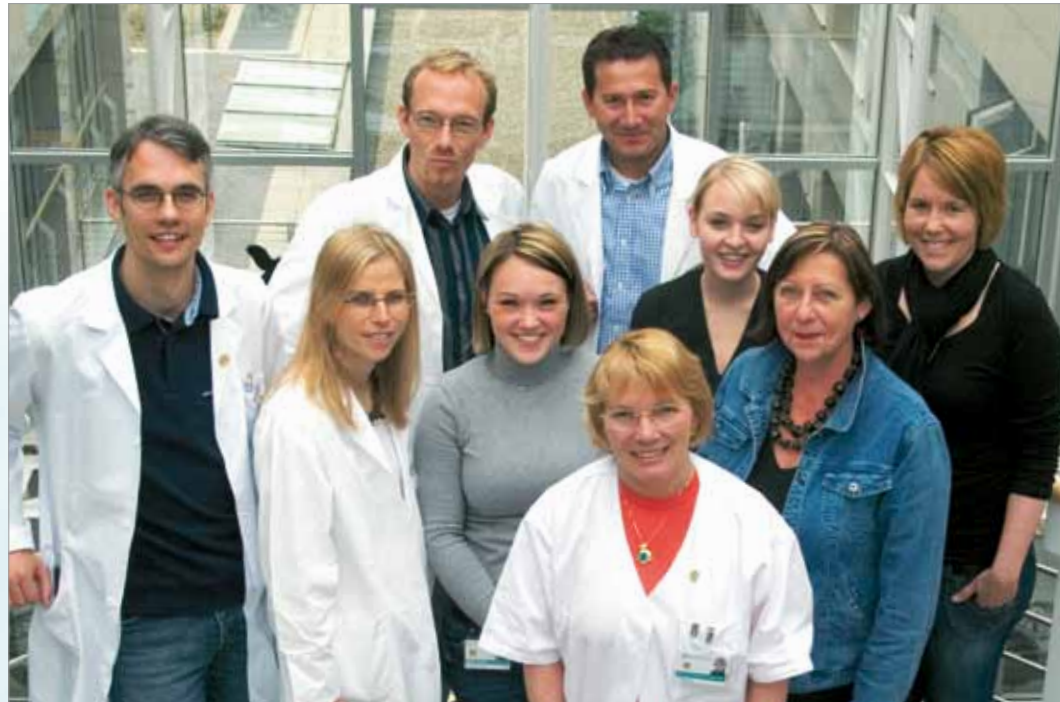
Mit viel Fachkompetenz und Motivation setzen wir uns ein für einen beschwerdearmen Alltag.